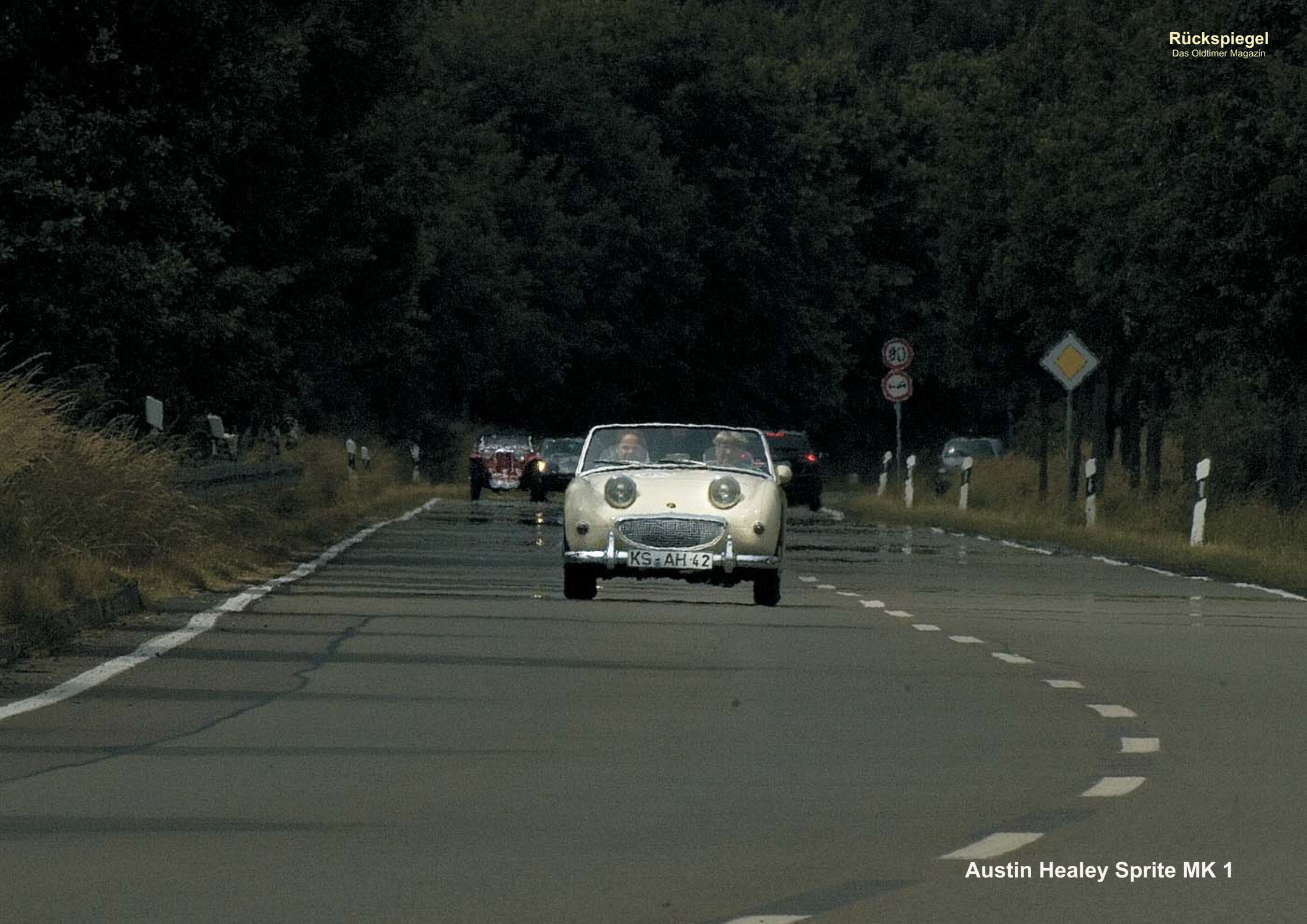
Austin Healey Sprite MK 1