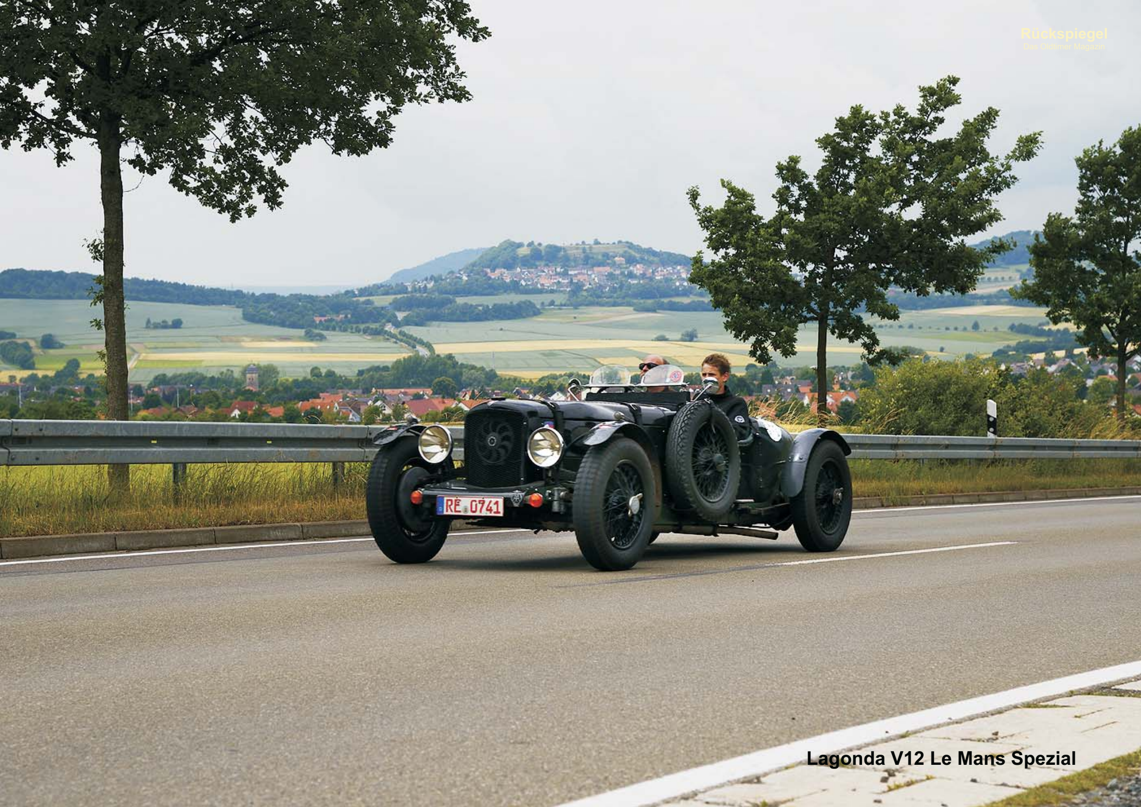
Lagonda V12 Le Mans Spezial