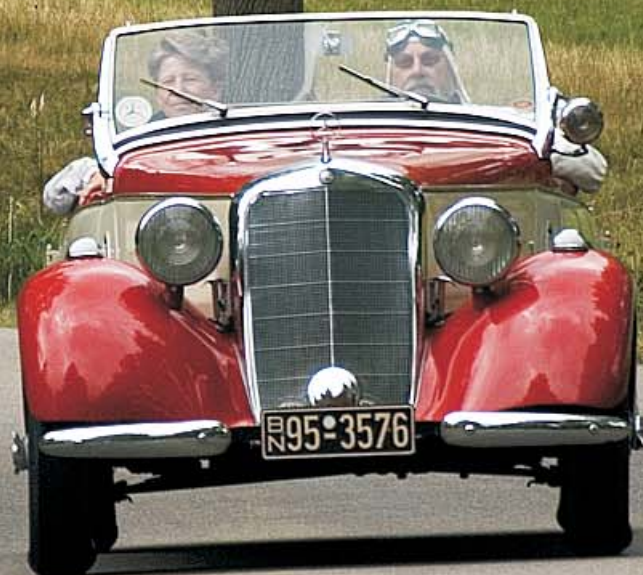
Mercedes Benz Roadster