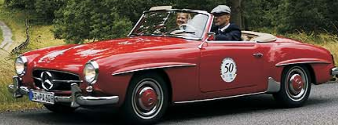
Mercedes 190 SL