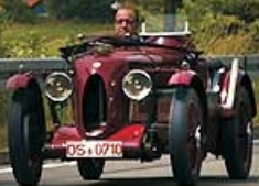
Austin Seven + MG