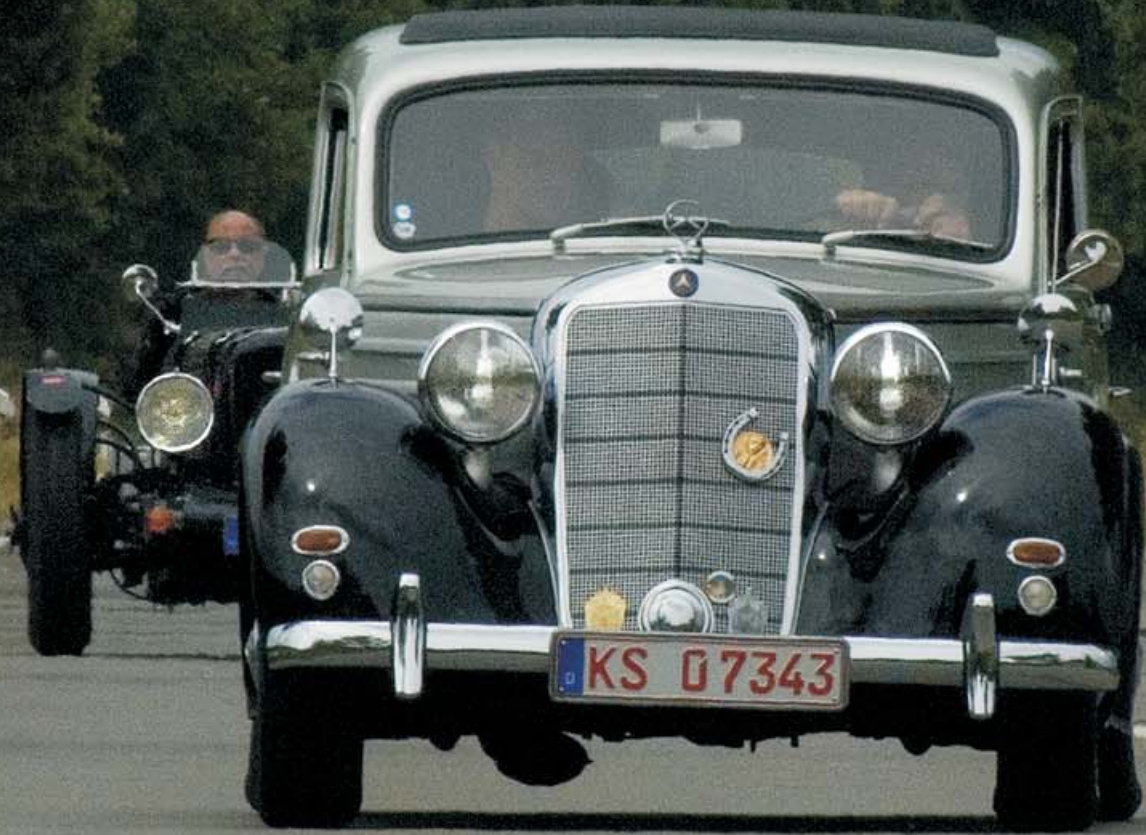
Mercedes 170 S