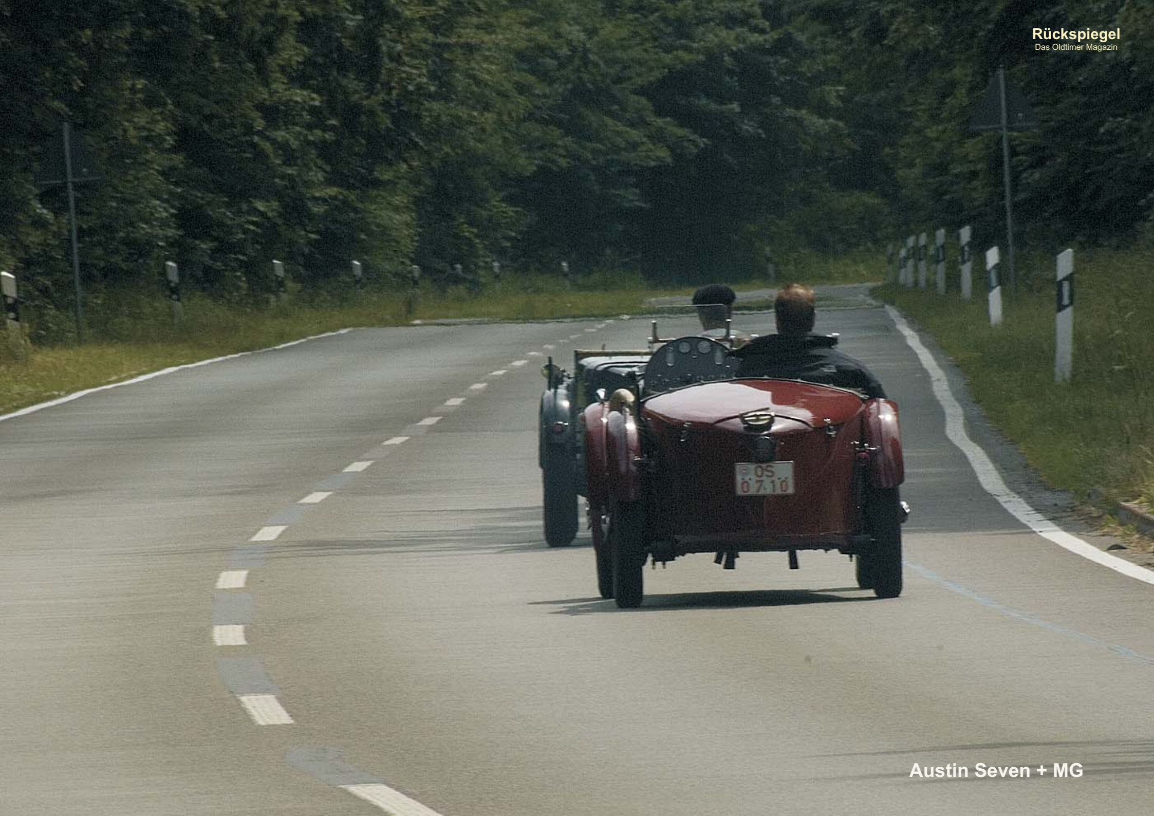
Austin Seven + MG