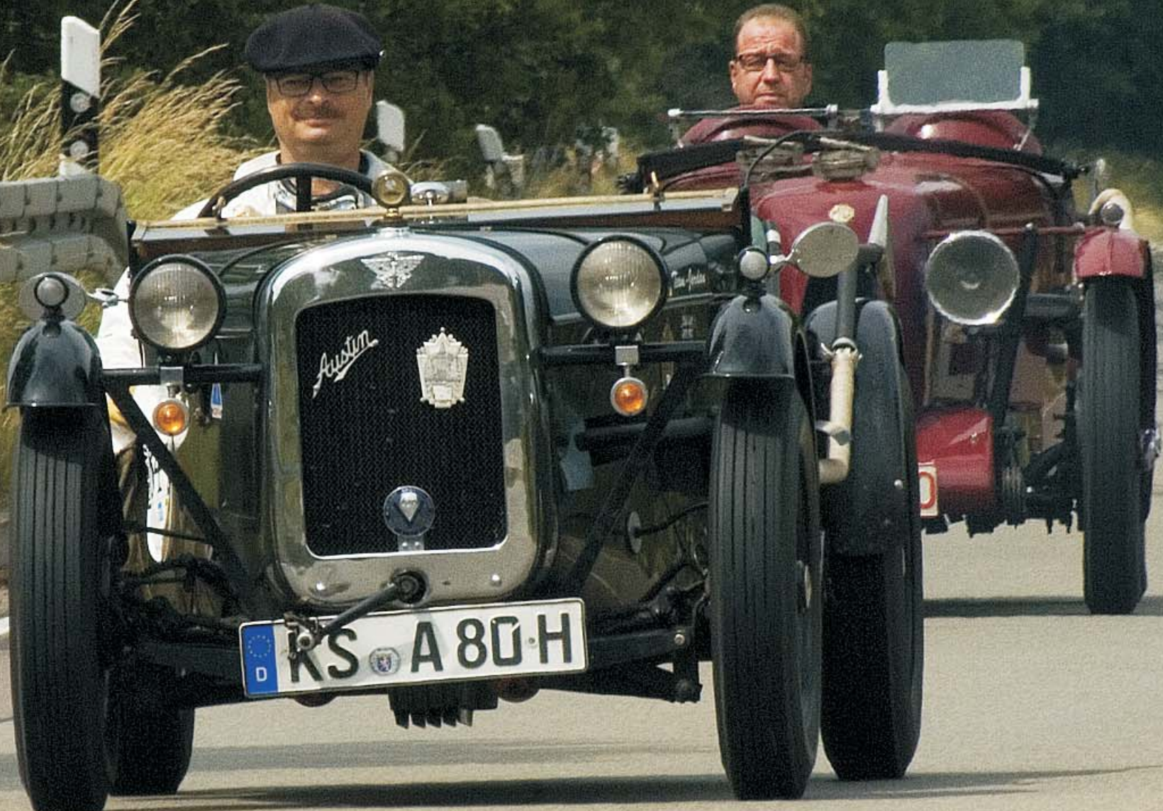
Austin Seven + MG