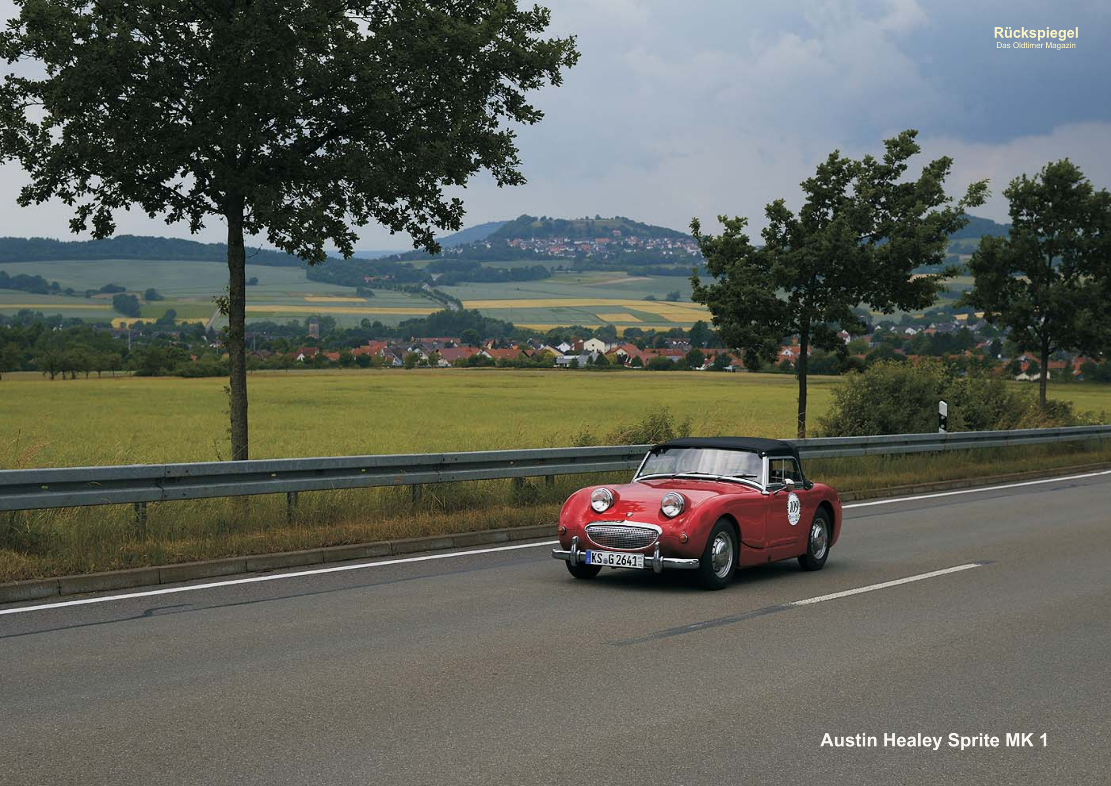
Austin Healey Sprite MK 1