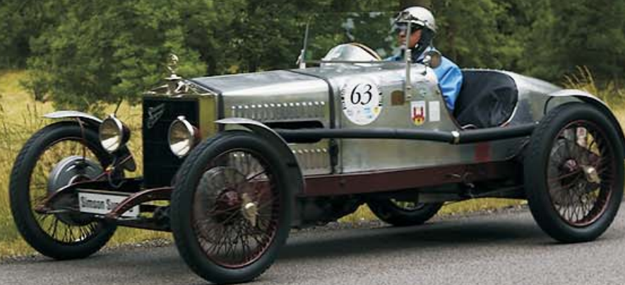
Simson Supr S