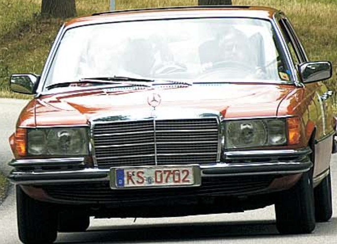
Peugeot 202 + Mercedes Benz 280 C