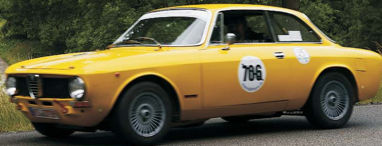
Alfo Romeo GTV 2000