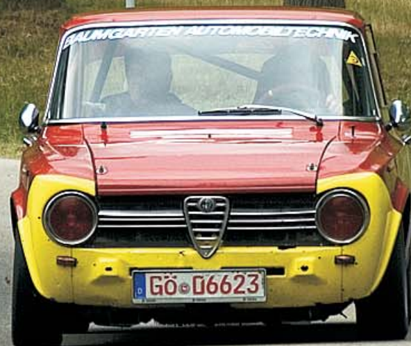
Alfa Romeo Giulia Super