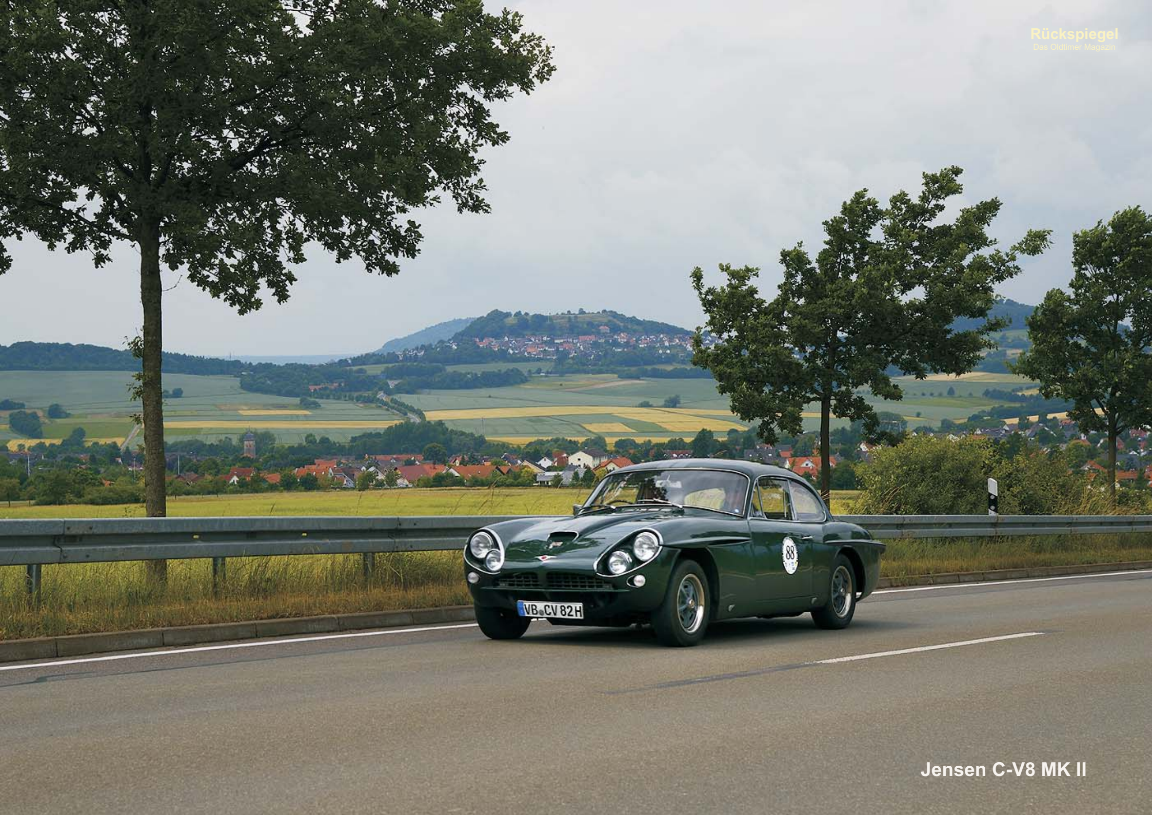
Jensen C-V8 MK II