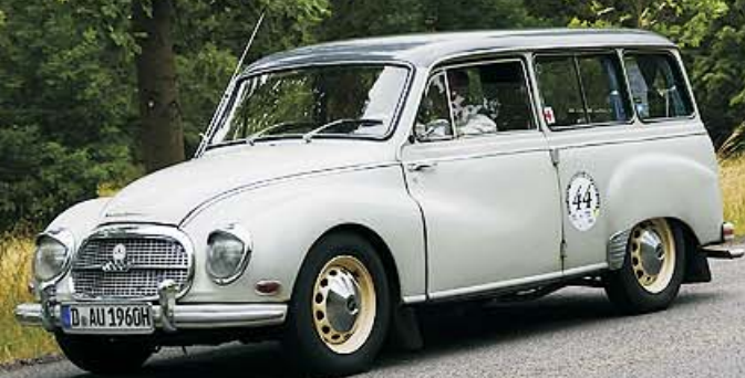
DKW 1000 Universal