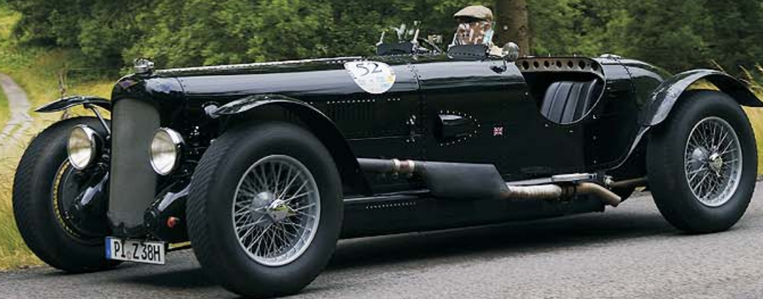
Lagonda V 12 Le Mans Spezial