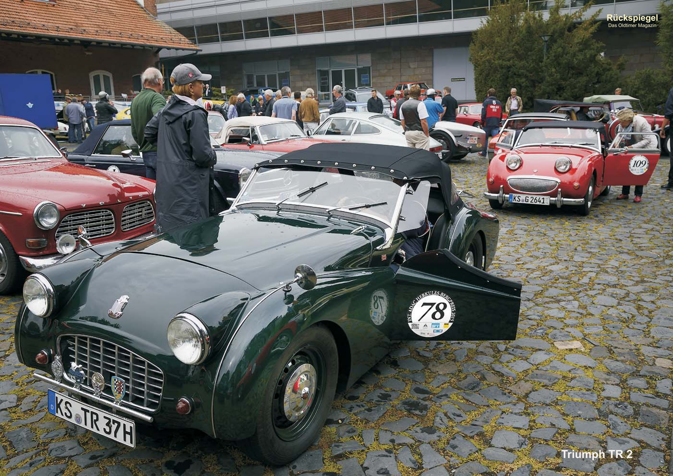
Triumph TR 2