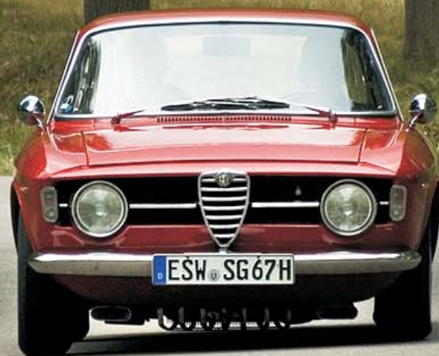
Alfa Romeo Giulia Sprint GT