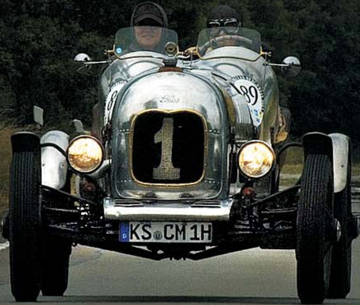
Ford A Speedster