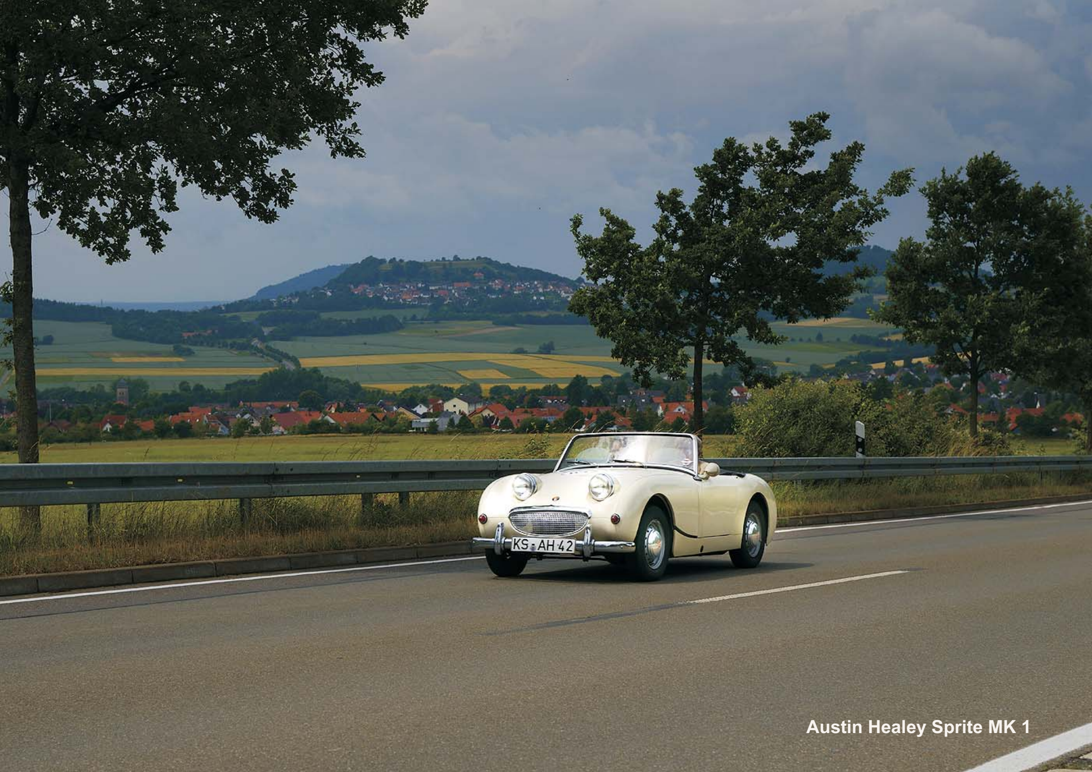
Austin Healey Sprite MK 1