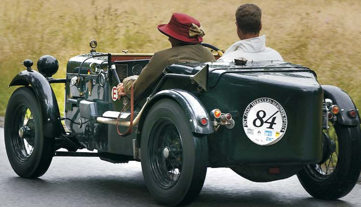
Austin Seven Sport