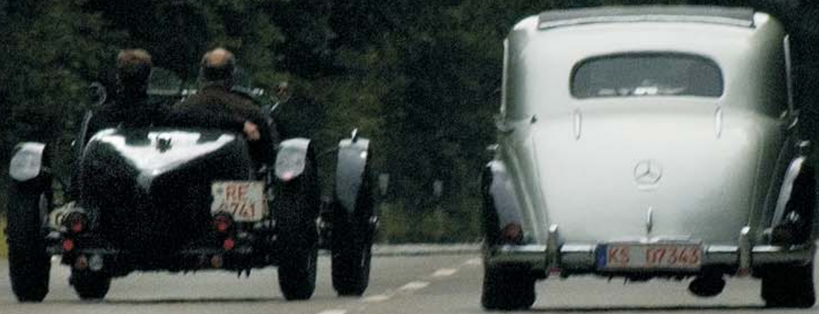
Duell in der Steigung