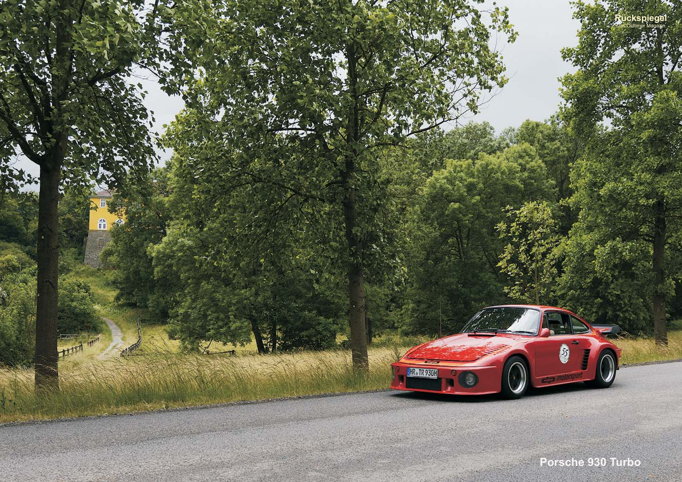
Porsche 930 Turbo