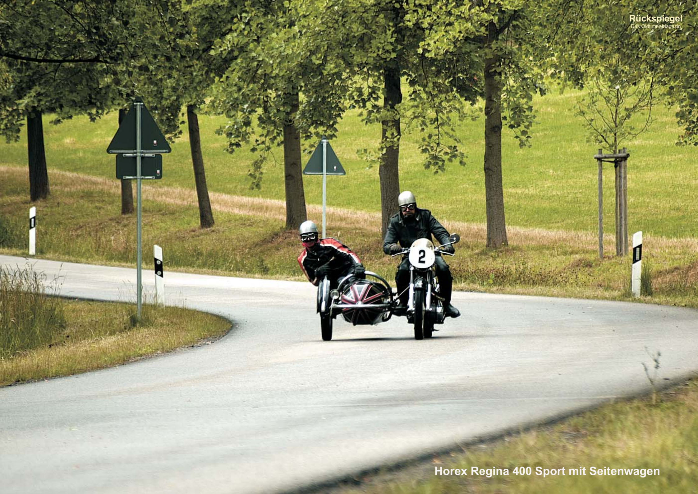
Horex Regina 400 Sport mit Seitenwagen