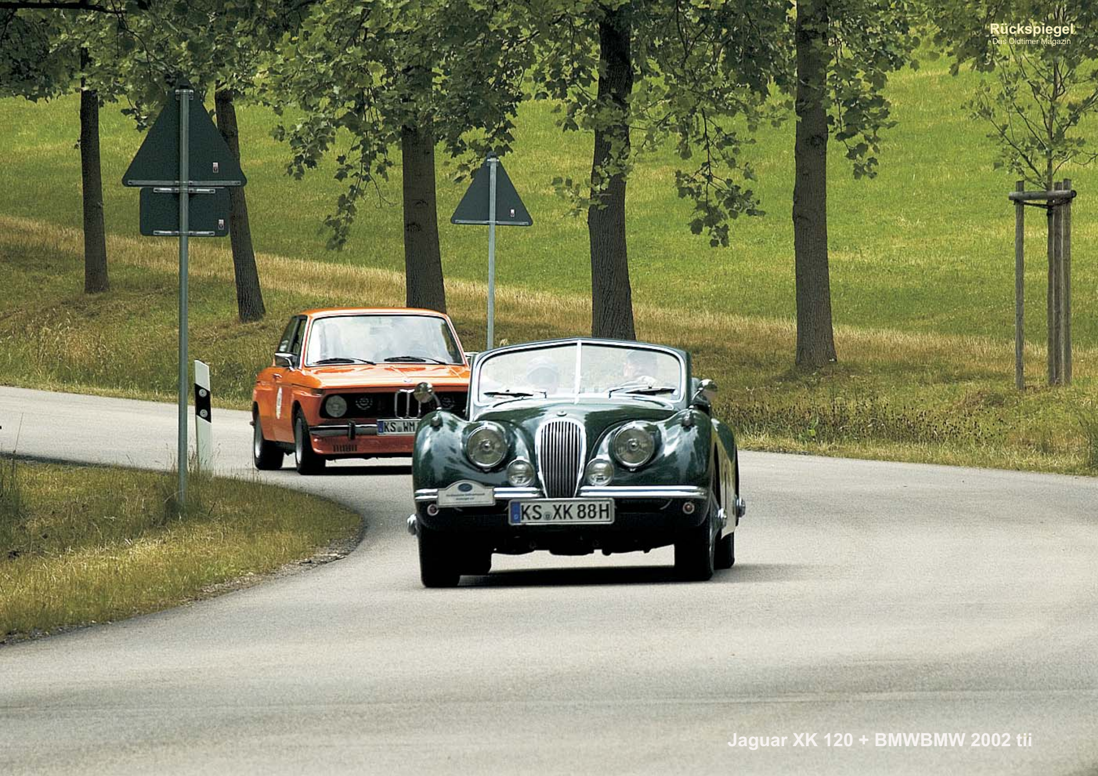
Jaguar XK 120 + BMWBMW 2002 tii