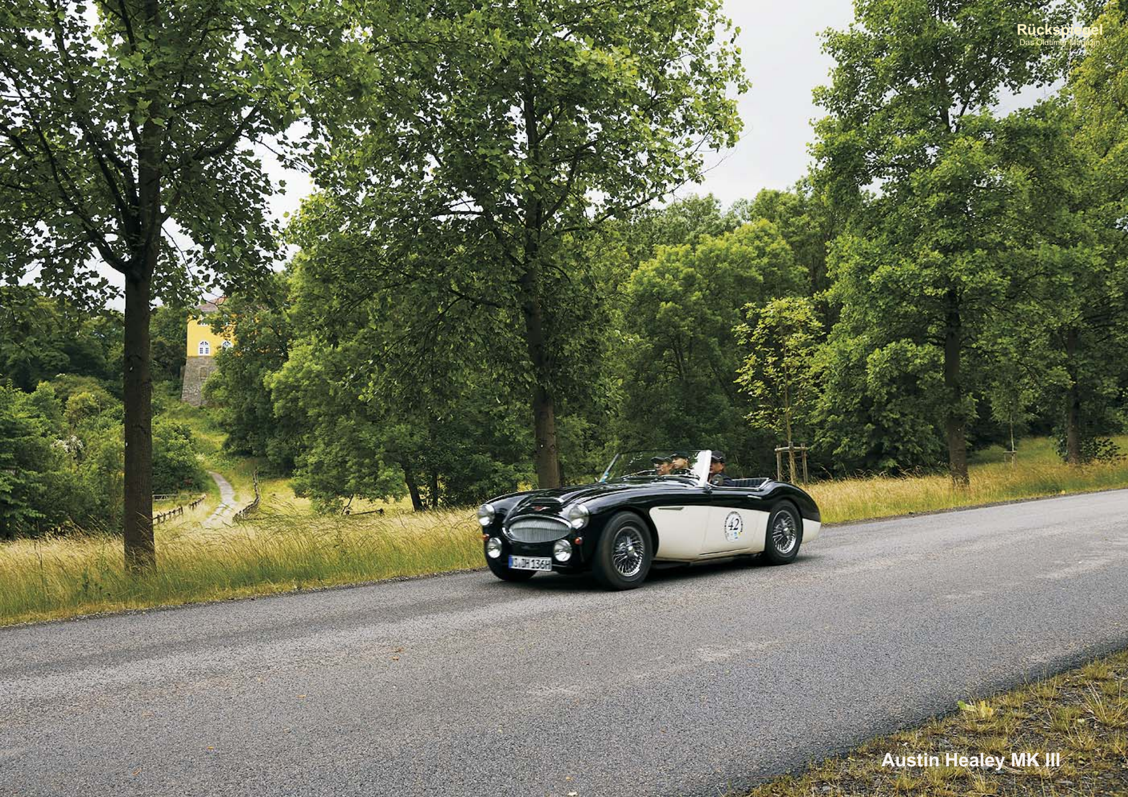
Austin Healey MK III