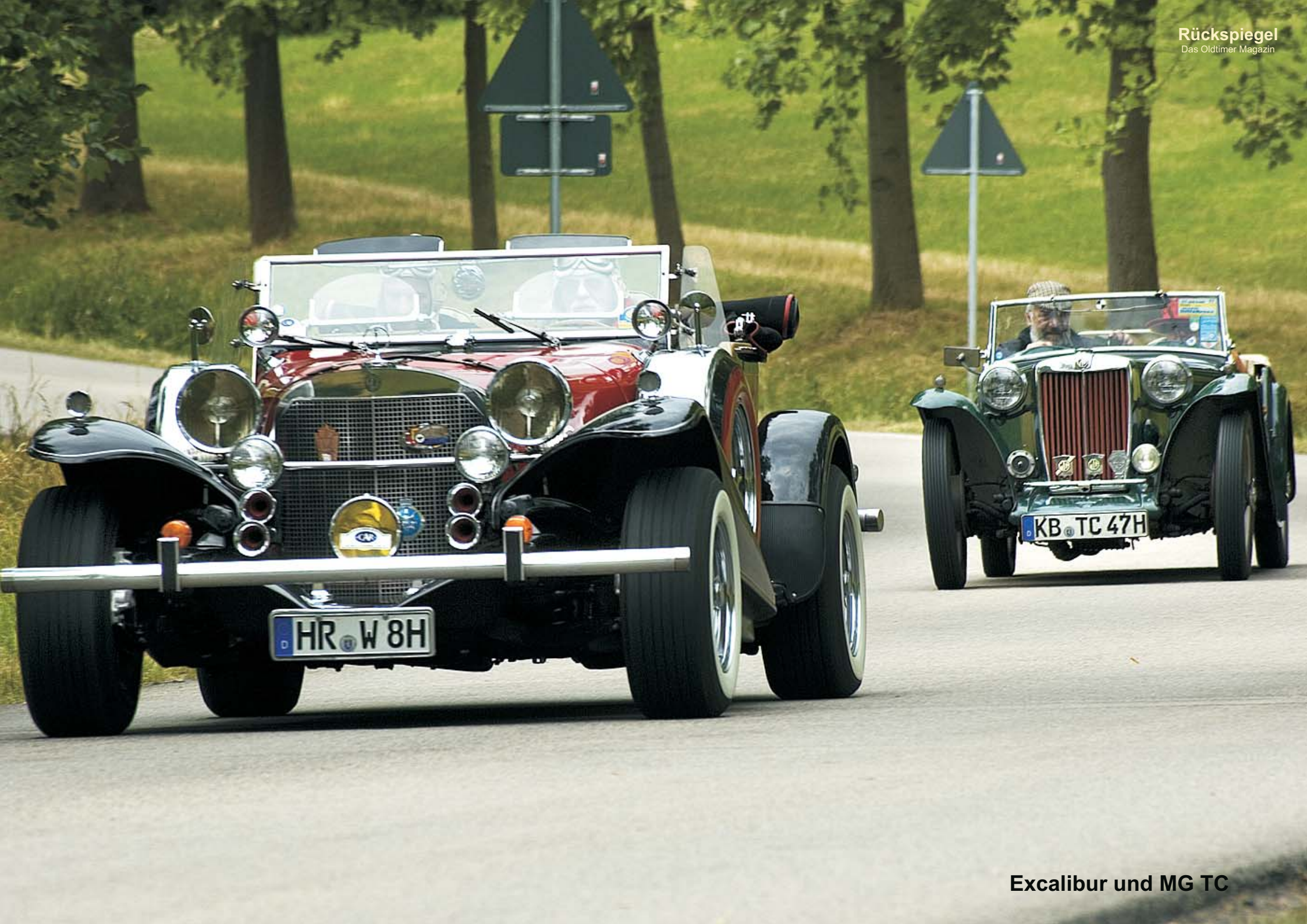
Excalibur und MG TC