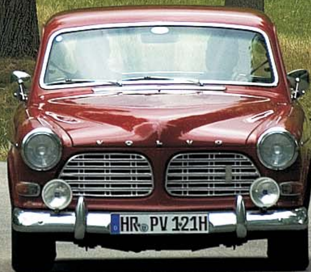
Volvo „Amazon“ P 121