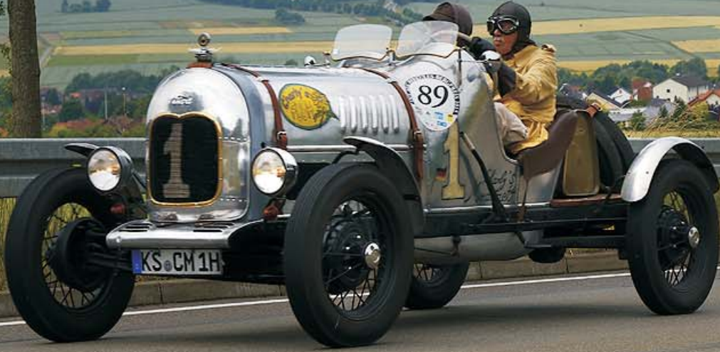
Ford A Speedster