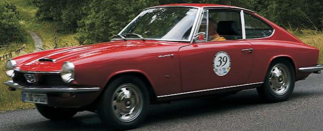
Glas 1700 GT